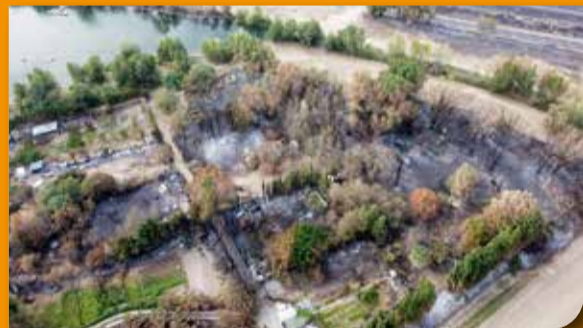
VUES AÉRIENNES DE LA SITUATION APRÈS INCENDIE ZONE OUEST – LAC N°4