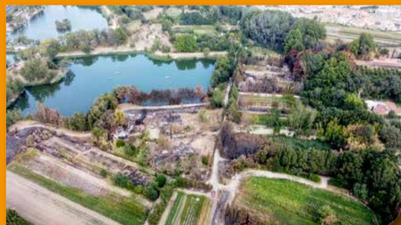
ZONE EST, LAC N° 3