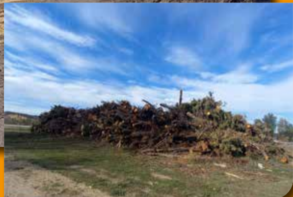
STOCKAGE DU BOIS COUPÉ